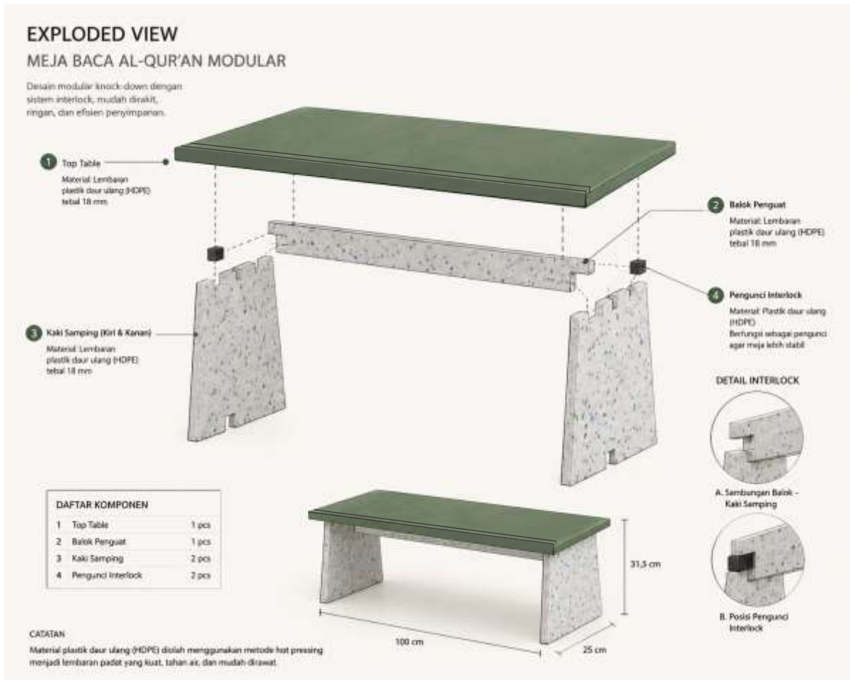
Gambar 7. Tampilan Beberapa Sisi dari Rancangan Meja Baca Al-Qur'an yang Diusulkan.