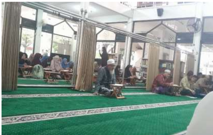
Gambar 3. Penggunaan Sarana Meja Baca Al-Qur'an Lipat di Masjid Baiturrahman oleh Jamaah.

Secara umum, Masjid Baiturrahman berdiri diatas luas tanah 1.400 m 2 dan memiliki luas keseluruhan bangunan 850 m 2 memuat berbagai fasilitas. Adapun fasilitas utama yang telah dimiliki oleh Masjid Baiturrahman diantara lain adalah adanya ketersediaan bangunan utama masjid dan bangunan TPQ, bar usaha “Kopi Taqwa”, ruang sekertariat masjid dan ta’mir, dapur umum, toilet dan area wudlu, teras, taman, area parkir umum dan disabilitas, Stand pengumpul minyak bekas dan Stand pengumpul limbah plastik botol. Berbagai fasilitas tersebut diadakan secara kolektif guna mendukung tujuan serta misi masjid yang berfungsi secara komperhensif menunjang pemenuhan kegiatan peribadatan, pendidikan, sosial, lingkungan, dan ekonomi jamaahnya.