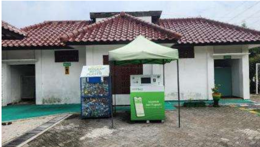
Gambar 2. Fasilitas Pengumpulan Limbah Plastik dan Minyak di Masjid Baiturrahman Sugihwaras, Candi Sidoarjo.

hanya berfungsi sebagai pusat ibadah, namun juga sebagai rumah sosial, lingkungan, pendidikan, hingga pusat pengembangan ekonomi bagi masyarakat (Husna, 2025) (Amrullah, 2015). Hal ini turut didukung oleh berbagai fasilitas yang memastikan visi bersama seluruh fungsi masjid dapat berjalan dengan baik dapat dipergunakan oleh jamaah dewasa hingga anak-anak.