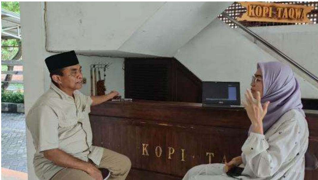
Gambar 5. Penggunaan Sarana Meja Baca Al-Qur'an Lipat di Masjid Baiturrahman.

Proses perancangan dimulai dengan sintesis hasil analisis kebutuhan berdasarkan kegiatan pengguna yang dihimpun melalui proses wawancara ketua ta'mir dan penelusuran dokumen Masjid Baiturrahman. Adapun beberapa prinsip pendekatan desain dirumuskan sebagai dasar pendekatan Eco-Design , yaitu adalah optimalisasi pemanfaatan pengolahan limbah plastik yang tersedia di sekitar dalam rancangan desain. Pendekatan Eco-Design ini berusaha mengintegrasikan aspek kesadaran akan pertimbangan lingkungan yang sudah ada diantara jamaah pada rancangan, mempertimbangkan proses kemandirian produksi dan siklus hidup produk dari bahan baku yang tersedia, hingga pembuangan akhir. Rancangan berdasarkan pendekatan ini juga mempertimbangkan potensi kekuatan dan keindahan yang dapat highlight melalui daur ulang limbah plastik botol High-Density Polyethylene , yang mendukung fungsionalitas dan keindahan produk sekaligus kuat, tahan air, dan mudah dirawat (Manalu, Aziz, Wynneputri, Hidayah, & Sholihah, 2025).