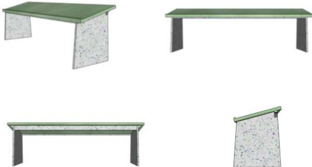
Gambar 6. Tampilan Beberapa Sisi dari Rancangan Meja Baca Al-Qur'an yang Diusulkan (Sumber: Penulis, 2026).

Budiyanto, 2024). Metode ini dipandang cocok dengan pendekatan Eco-Design rancangan untuk dapat dilaksanakan oleh jamaah masjid yang berguna untuk meningkatkan kemandirian dalam mengelola limbah plastik dan lebih memiliki nilai ekonomi. Sebagaimana kaitannya pada rekomendasi rancangan meja baca Al-Qur'an yang akan ditawarkan, papan atau lempengan padat yang kuat dan estetis dipotong melalui beberapa bentuk modul. Pemotongan modul menyesuaikan dengan komponen-komponen yang dibutuhkan dalam membuat Meja baca Al-Qur'an knock down .