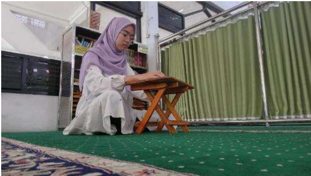
Gambar 4. Evaluasi Sarana Meja Baca Al-Qur'an Lipat di Masjid Baiturrahman.

pengajian dan kegiatan keagamaan lainnya. Adapun diantaranya merupakan meja baca Al-Qur'an lipat, proyektor, karpet, tenda, dan pengeras suara. Meskipun demikian, kualitas dan kuantitas beberapa inventaris seperti meja ngaji lipat kerap menjadi kendala untuk sebagian besar jamaah yang didominasi oleh masyarakat lansia. Selain itu meja baca Al-Qur'an lipat yang dipergunakan berbahan kayu konvensional, yang jumlahnya terbatas dan kondisinya mulai menurun karena usia pemakaian. Sebagaimana disebutkan oleh Mutiara (2025) bahwa peran masjid sebagai pusat kegiatan keagamaan dan sosial memerlukan untuk menyediakan fasilitas yang memadai kegiatan sekaligus mendukung kenyamanan dan kepuasan penggunaannya. Optimalisasi sarana pendukung khususnya perlengkapan ibadah yang ergonomis dan berkelanjutan penting untuk mendukung efektifitas aktifitas masjid yang lebih inklusif (Fauzzia, et al., 2018) (Suryawati, 2021).