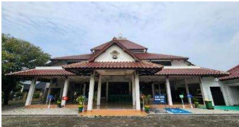
Gambar 1. Masjid Baiturrahman Sugihwaras, Candi Sidoarjo (Sumber: Penulis, 2026).

Masjid Baiturrahman merupakan rumah ibadah yang terletak di Perumahan TNI AL Jalagriya, Dusun Rejo, Desa Sugihwaras, Kecamatan Candi, Kabupaten Sidoarjo. Masjid Baiturrahman telah berdiri sejak tahun 2001 dan telah aktif beroperasi hingga saat ini. Berdasarkan klasifikasinya, masjid baiturrahman merupakan tipe masjid Jami' yang berfungsi sebagai pusat kegiatan peribadatan, kegiatan sosial ditingkat desa, kelurahan, atau pemukiman. Berdasarkan pengertian etimologi, masjid jami atau masjid jumu'ah merujuk pada kata jami' (جامع), yang memiliki arti mempertemukan atau menyatukan (Mitias & Jasmi, 2018). Klasifikasi ini turut menyesuaikan dengan kepadatan aktifitas Masjid Baiturrahman yang memegang teguh visi untuk mewujudkan peradaban ummat yang rahmatan lil alamin . Perwujudan visi tersebut mendorong komitmen kegiatan jamaah yang diantara lain bertujuan untuk meningkatkan kualitas pelaksanaan peribadatan berdasarkan Al Qur'an dan Hadist, pemberdayaan jamaah dan kepengurusan masjid yang amanah, profesional, dan akuntabel, melaksanakan penelitian dan pengembangan manajemen masjid secara profesional, menumbuhkan kesolehan sosial dan ekonomi ummat melalui berbagai kegiatan sosial dan ekonomi syariah, serta mengadakan kerjasama dengan masjid atau lembaga lainnya yang terkait dengan pengembangan masjid (Kristiyanto, 2025).